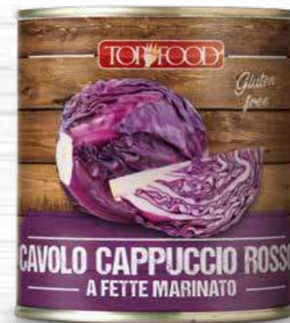
MARINATED SLICED RED CABBAGE 800g ..... Cod. 70087