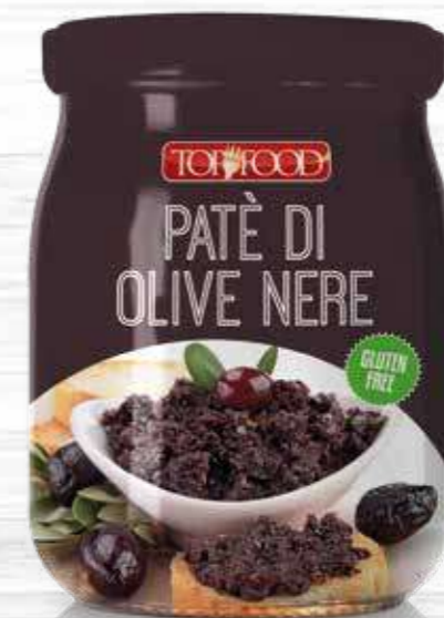
BLACK OLIVES SAUCE 520g Cod. 10359