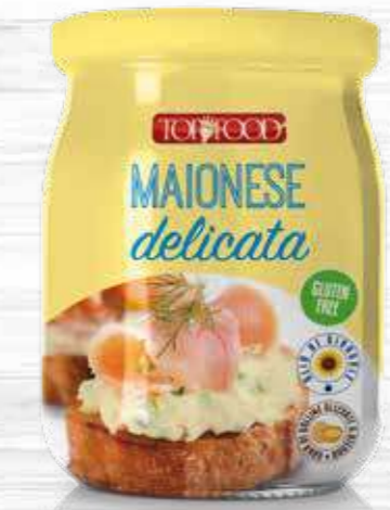
MAYONNAISE 500g Cod. 10218