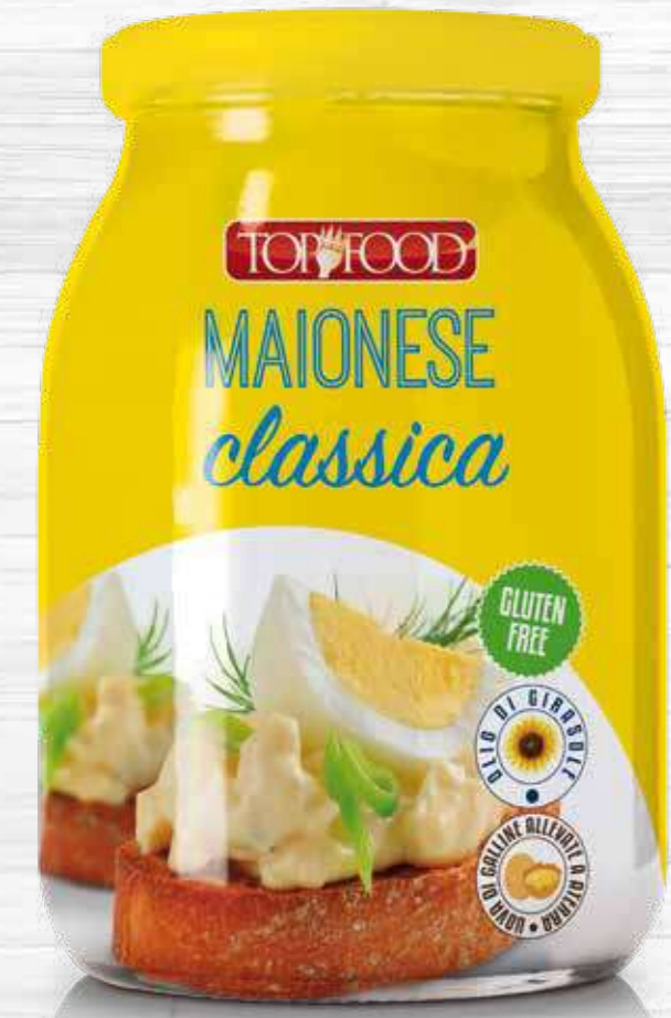
MAYONNAISE 950g Cod. 10220