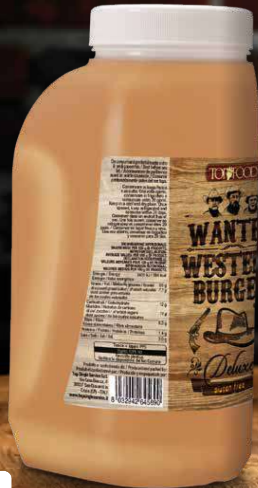
WANTED WESTERN BURGER DELUXE 2300g Cod. 10389