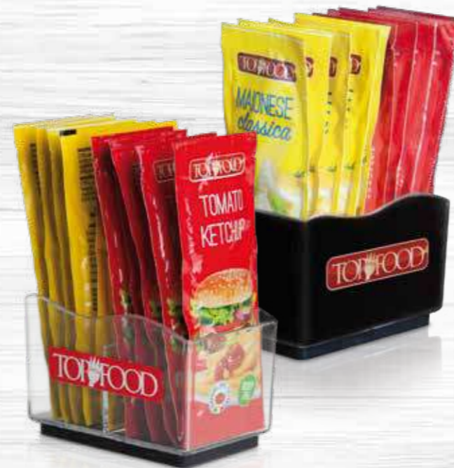
VASCHEE PORTA MONODOSI SINGLE BAG HOLDER