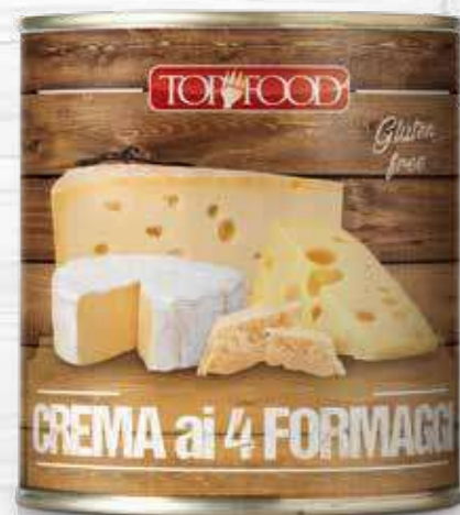
4 CHEESES SAUCE 800g ..... Cod. 10306