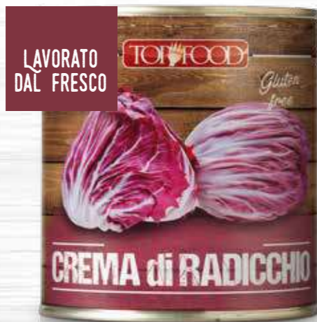
RED CHICORY SAUCE 800g ..... Cod. 10300