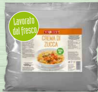
PUMPKIN SAUCE 1200g Cod. 11021