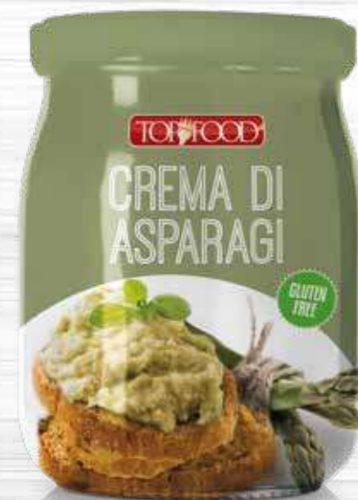
ASPARAGUS SAUCE 520g Cod. 10351