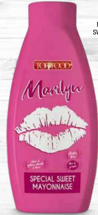
MARILYN SPECIAL SWEET MAYONNAISE 950g Cod. 10167