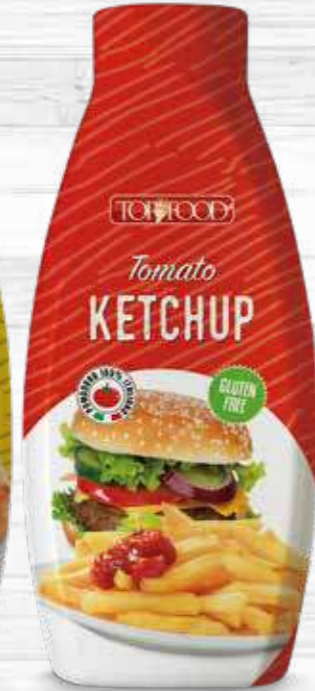
TOMATO KETCHUP 1070g Cod. 10041