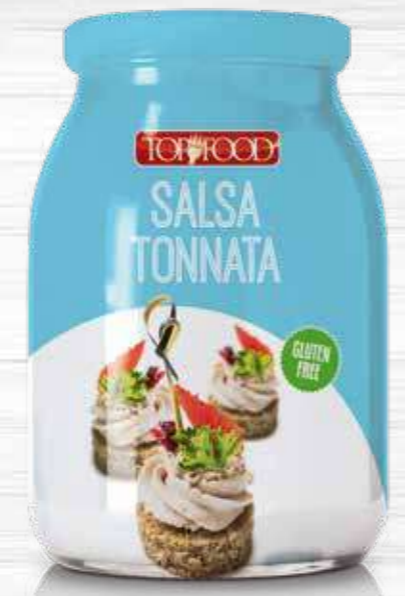
TUNA SAUCE 950g Cod. 10222