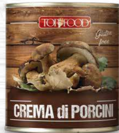
BOLETUS MUSHROOMS SAUCE 800g ..... Cod. 10302