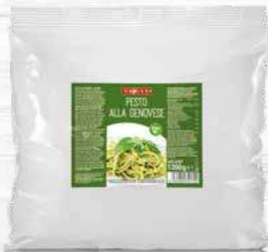
PESTO GENOVESE 1200g Cod. 11022