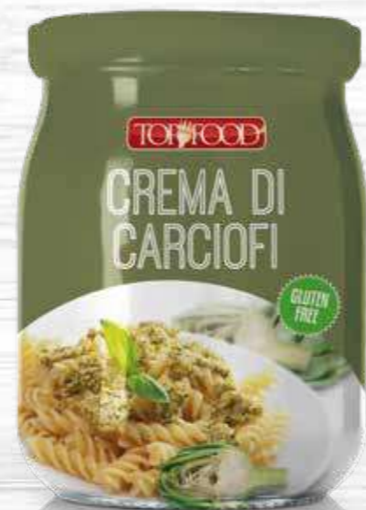
ARTICHOKES SAUCE 520g Cod. 10353