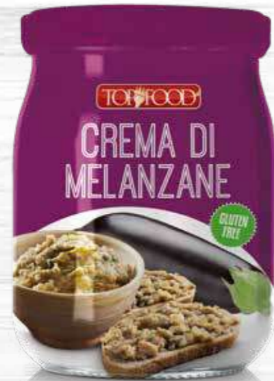
AUBERGINES SAUCE 520g Cod. 10363