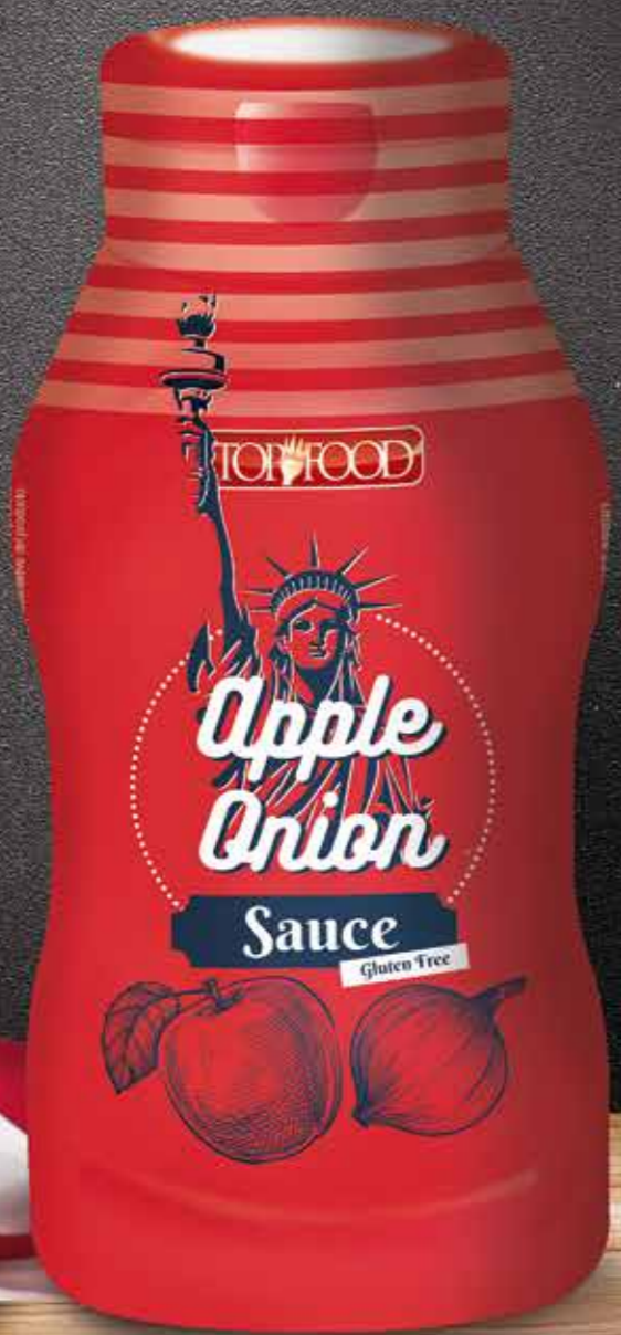
Apple onion sauce 540 g cod. 19091