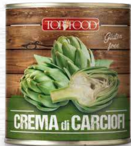
ARTICHOKES SAUCE 800g ..... Cod. 10303