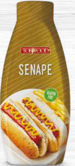
MUSTARD 1070g Cod. 10061