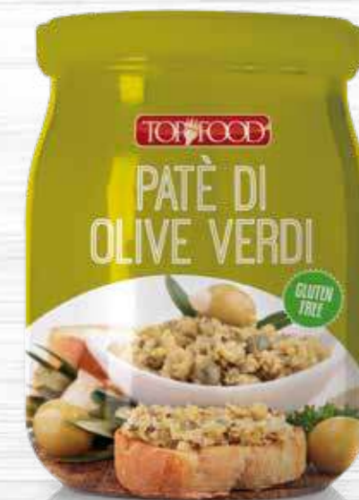
GREEN OLIVES SAUCE 520g Cod. 10358