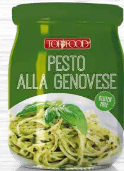
PESTO GENOVESE 520g ..... Cod. 10355