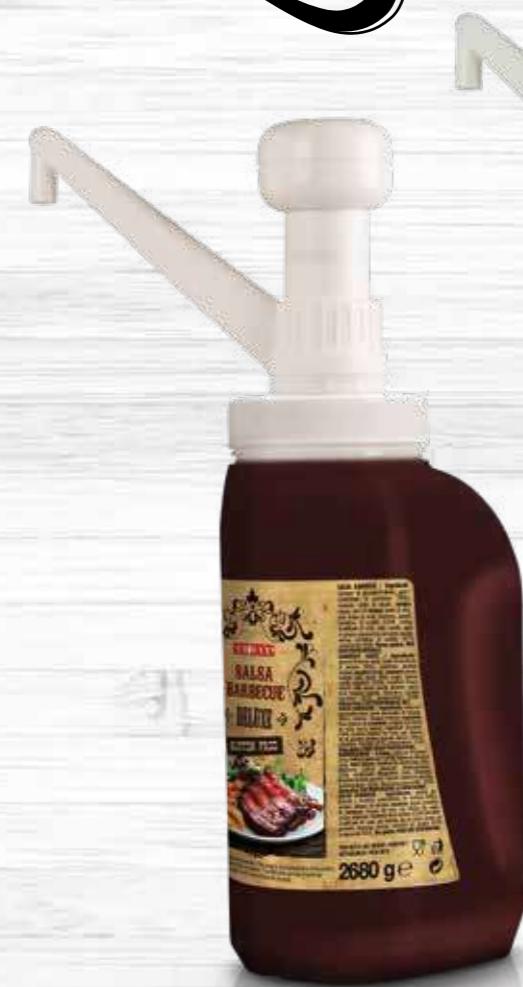
POMPETTA DOSATRICE PER TANK Dosing pump for Tank Cod. 99012