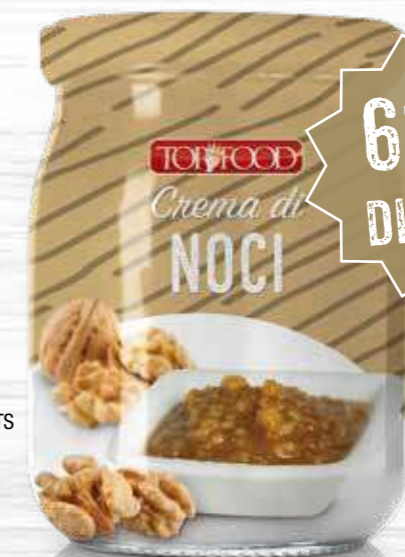
SAUCE WITH WALNUTS 500g ..... Cod. 10367