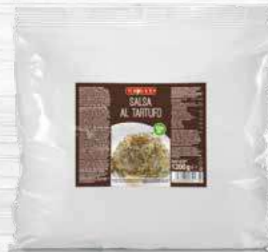
TRUFFLE SAUCE 1200g Cod. 11023