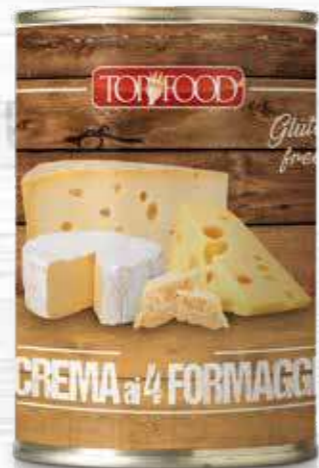
4 CHEESES SAUCE 420g ..... Cod. 10331