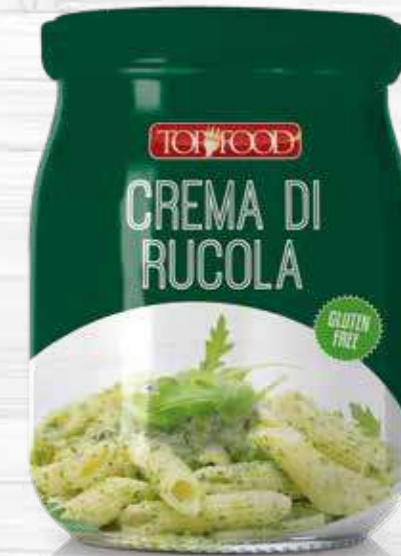
ROCKET SALAD SAUCE 500g Cod. 10368