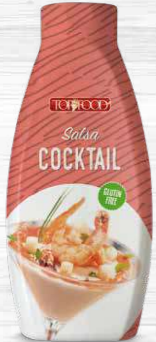
COCKTAIL SAUCE 970g Cod. 10161