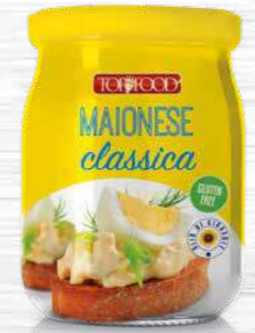
MAYONNAISE 500g Cod. 10219