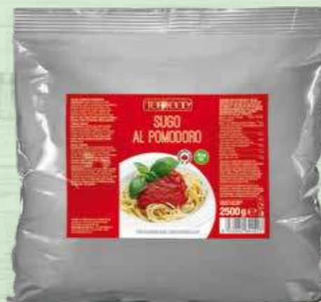
TOMATO SAUCE 2500g Cod. 11001