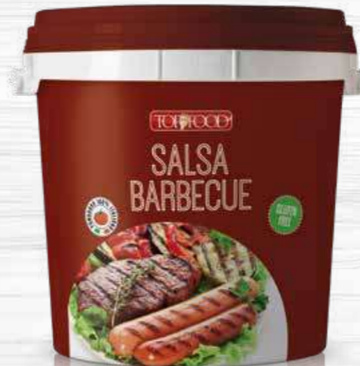
BARBECUE SAUCE 5000g Cod. 10049