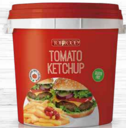
TOMATO KETCHUP 5000g Cod. 10034