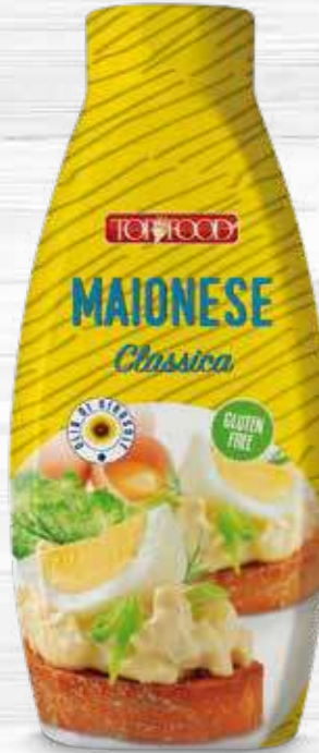
MAYONNAISE 950g Cod. 10011