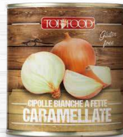
WHITE SLICED CAMELIZED ONIONS IN SWEET AND SOUR 800g ..... Cod. 70046