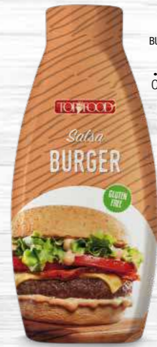
BURGER SAUCE 1000g Cod. 10040