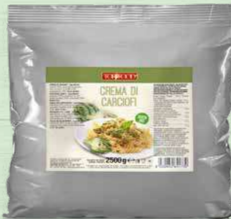
ARTICHOKES SAUCE 2500g Cod. 11030