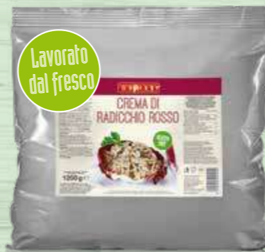
RED CHICORY SAUCE 1200g Cod. 11024