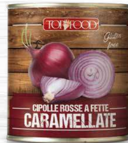
RED SLICED CAMELIZED ONIONS IN SWEET AND SOUR 800g ..... Cod. 70047