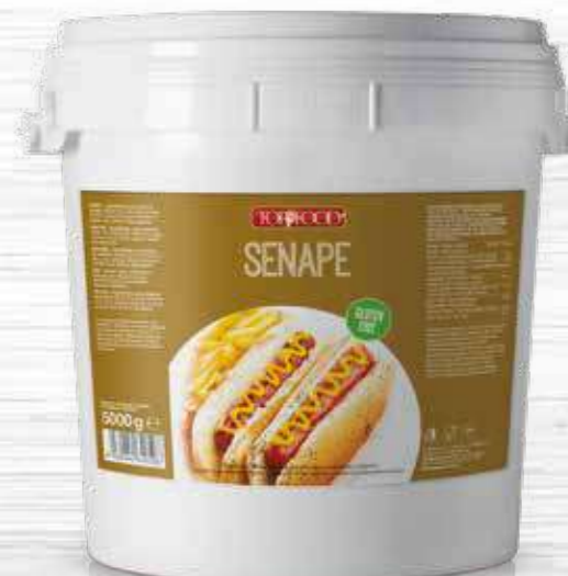
MUSTARD 5000g Cod. 10050