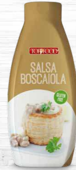
MUSHROOM SAUCE 970g Cod. 10165