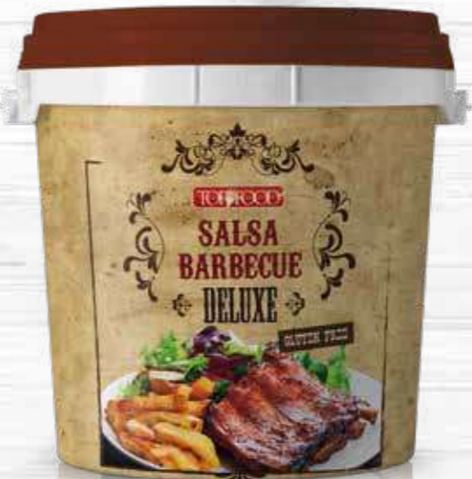
BBQ DELUXE 5000g Cod. 10180