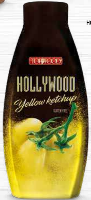
HOLLYWOOD GOLD SAUCE 1170g Cod. 10159