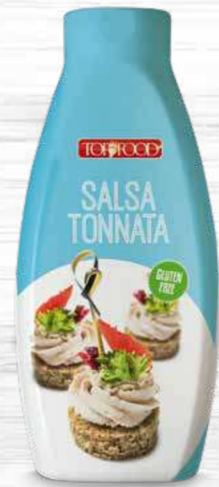
TUNA SAUCE 950g Cod. 10164