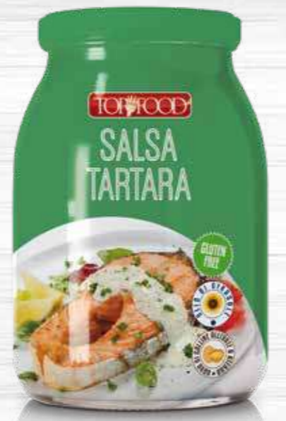
TARTARA SAUCE 940g Cod. 10223