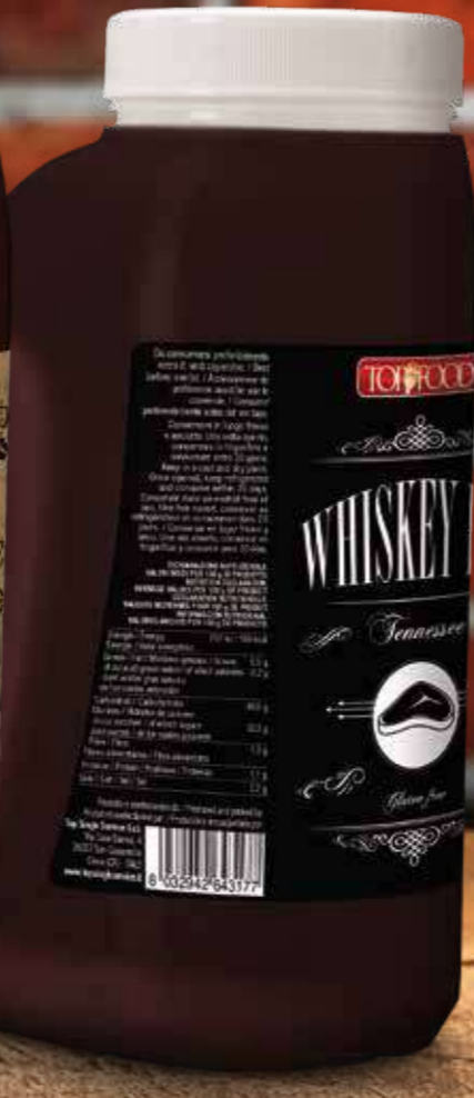
WHISKEY BBQ 2680g Cod. 10372