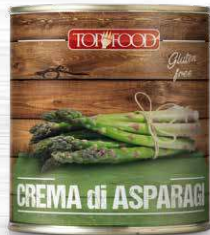
ASPARAGUS SAUCE 800g ..... Cod. 10301