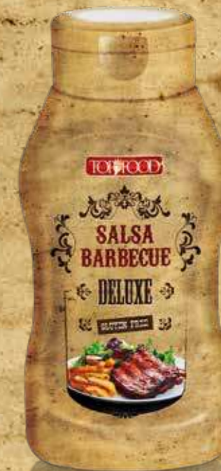
SQUEEZER 600 G