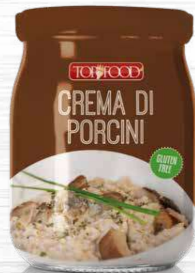
BOLETUS MUSHROOMS SAUCE 520g Cod. 10352