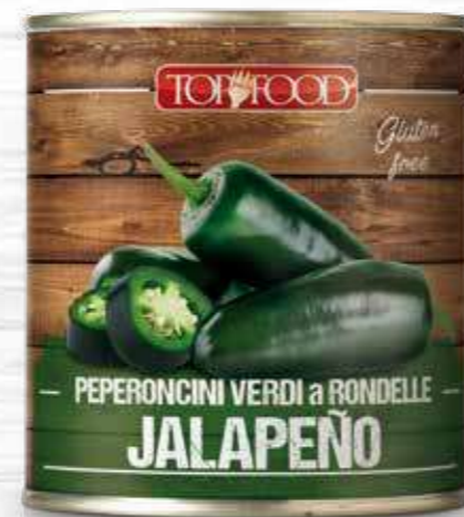
SLICED GREEN "JALAPEÑO" CHILI PEPPERS 750g ..... Cod. 70051