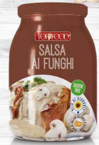
MUSHROOM SAUCE 930g Cod. 10225