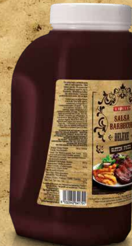
TANICA TANK 2680g