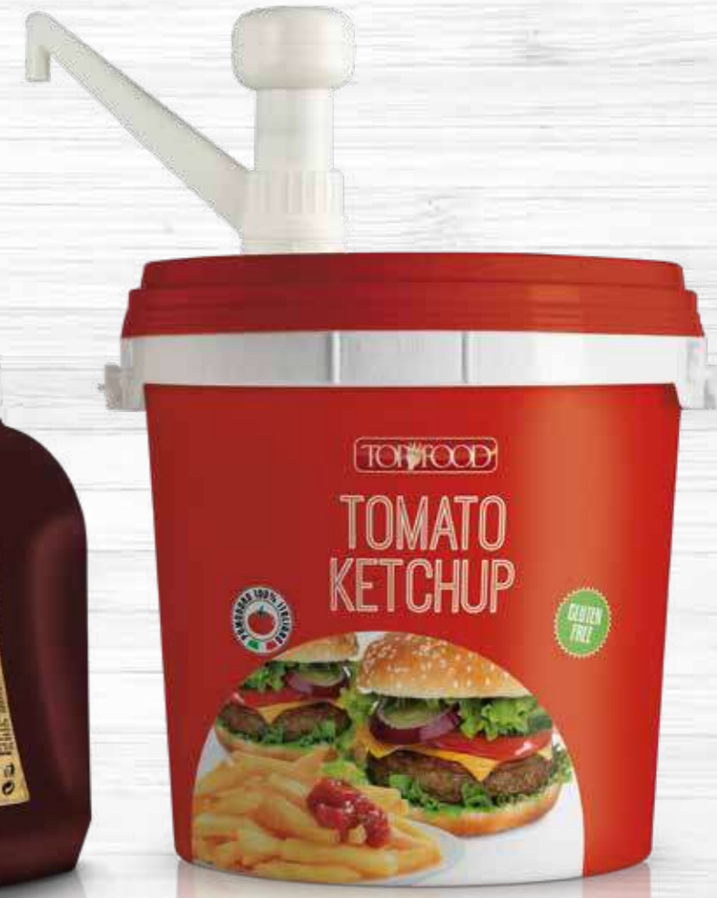
POMPETTA DOSATRICE PER SECCHIELLI 5KG Dosing pump for Buckets Cod. 99026