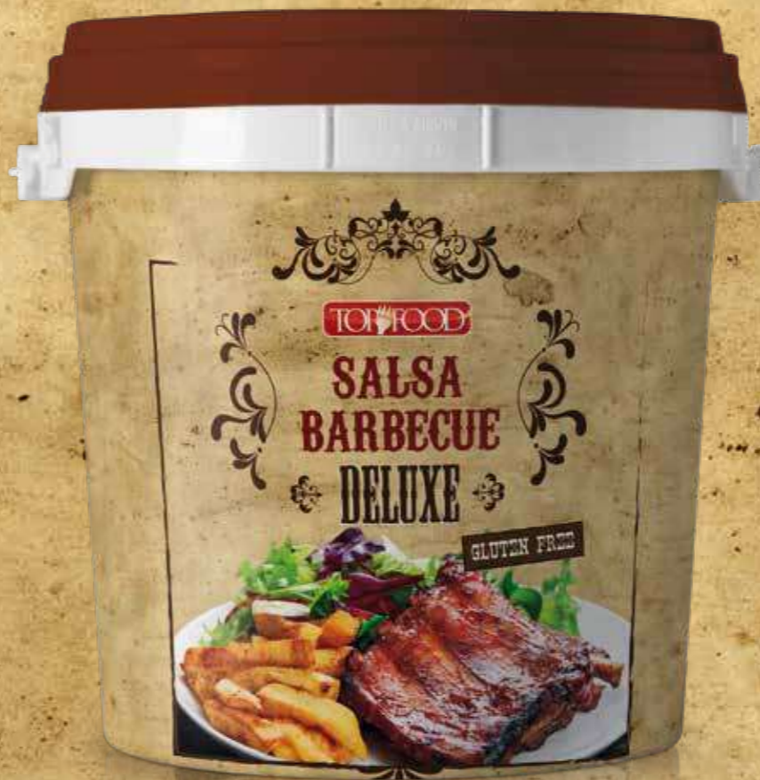
SECCHIELLO BUCKET 5000g