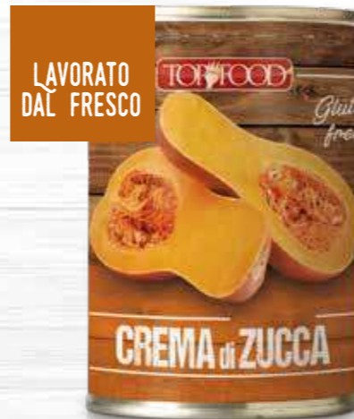
PUMPKIN SAUCE 420g ..... Cod. 10330