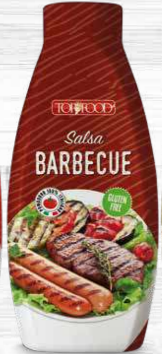
BARBECUE SAUCE 1170g Cod. 10045