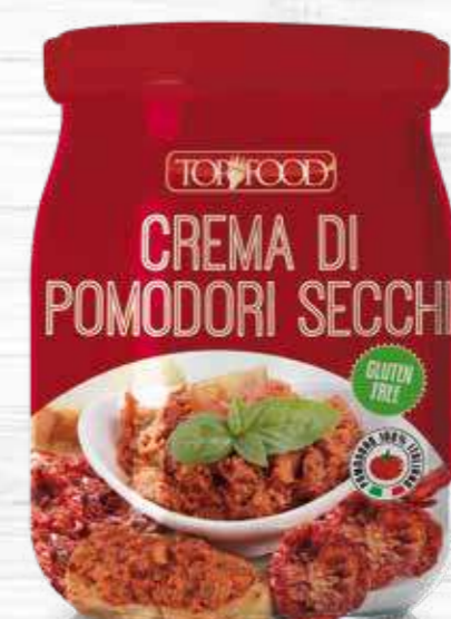
SUNDRIED TOMATOES SAUCE 520g ..... Cod. 10354