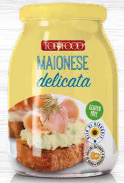
MAYONNAISE 950g Cod. 10217