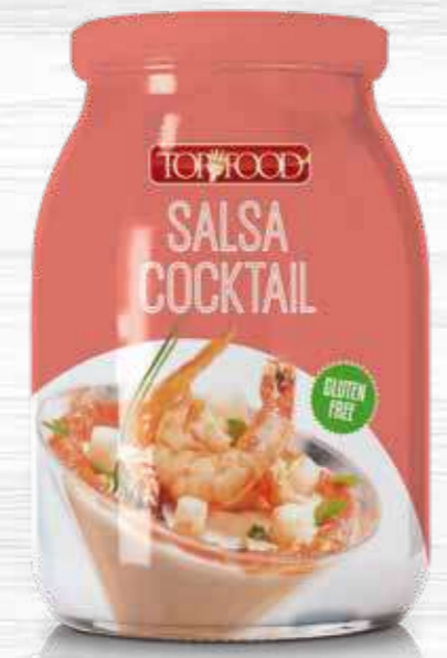
COCKTAIL SAUCE 970g Cod. 10221