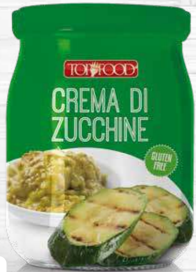
ZUCCHINI SAUCE 520g Cod. 10364