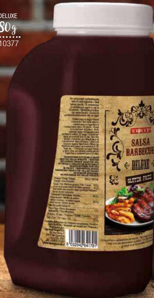
BBQ DELUXE 2680g Cod. 10377