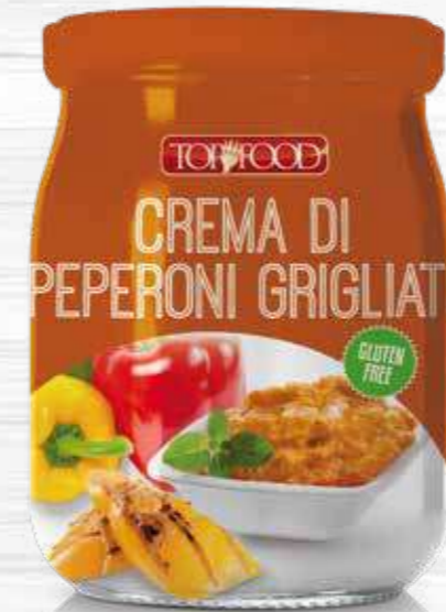
GRILLED PEPPERS SAUCE 520g ..... Cod. 10362