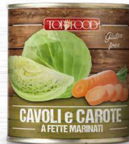
MARINATED SLICED CABBAGES AND CARROTS 800g ..... Cod. 70088