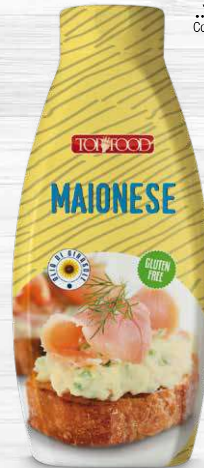
MAYONNAISE 950g Cod. 10142