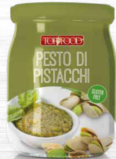
PESTO OF PISTACHIO 500g ..... Cod. 10381